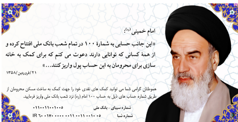
امام خمینی (ره):

«این جانب حسابی به شماره ۱۰۰ در تمام شعب بانک ملی افتتاح کرده و از همه کسانی که توانایی دارند دعوت می‌کنم که برای کمک به خانه سازی برای محرومان به این حساب پول واریز کنند...»