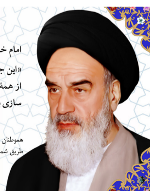
امام خمینی (ره):

هموطنان گرامی شما می‌توانید کمک‌های نقدی خود را جهت کمک به ساخت مسکن محرومان از طریق شماره حساب‌های ذیل به حساب ۱۰۰ امام (ره) نزد شعب بانک ملی واریز فرمایید. شماره شبای - بانک ملی: ۰۱۱۰۰۱۱۰۰۰۰۰۰ شماره شبا: IR 6۰۰۱۷۰۰۰۰۰۰۱۱۰۰۱۱۰۰۰۰۰۰